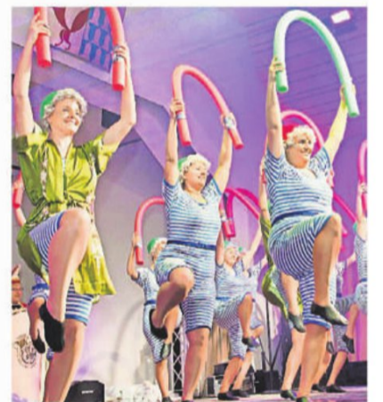
Showtanzeinlage der Prinzengarde