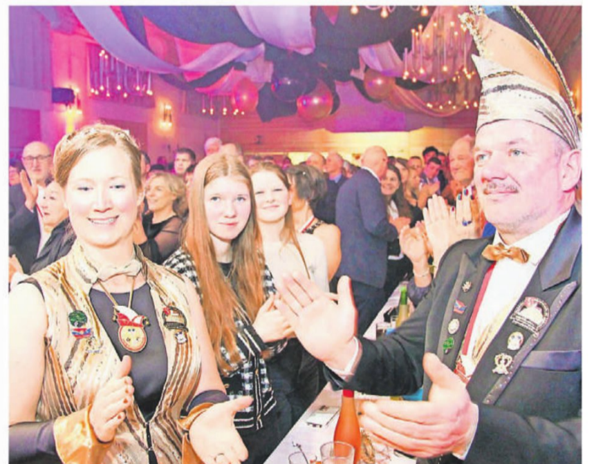
Das Prinzenpaar verteilte kräftig Orden und applaudierte hohheitlich den Darbietungen.