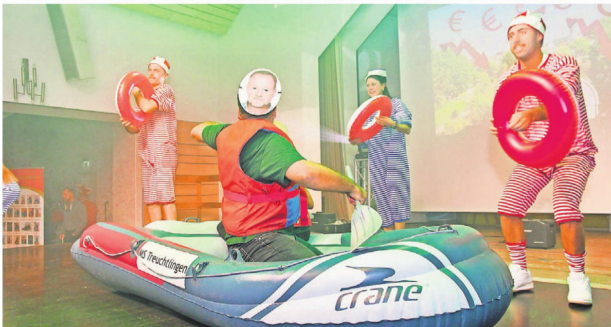
Mit der MS Treuchtlingen, der „Lauterbachtüte“, dem besten fränkischen Bier oder gemütlich im Auto lässt sich die Altmühlstadt genießen.